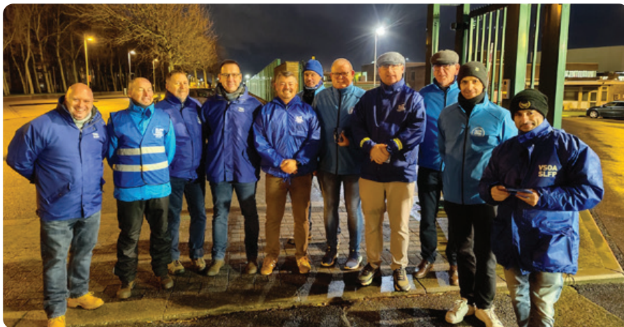
Bijkomende informatie en foto's vinden jullie terug op de Facebookpagina van VSOA-Defensie.

Wij wensen dan ook alle lokale afgevaardigden en leden te bedanken voor hun warme ontvangst, vriendelijke lach en de getoonde inzet. Het bewijst nogmaals waarom wij een belangrijke vakbond binnen Defensie zijn en uitblinken in onze ledenwerking.