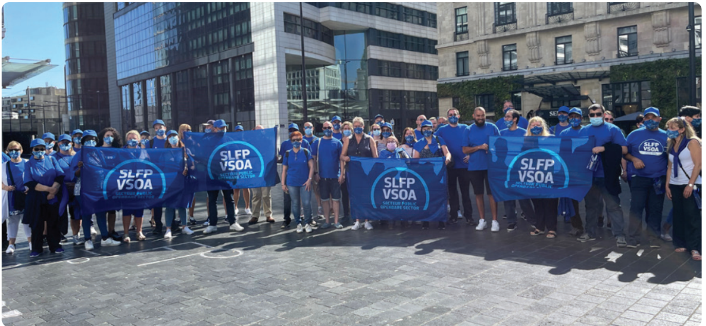
De VSOA-LRB-afgevaardigden van het Brussels gewest.

Het VSOA, dat ook het personeel van de OCMW's in het Brussels Gewest vertegenwoordigt, hekelt het besluit van de Brusselse gewestregering om de subsidies aan de OCMW's voor eerstelijnsposities die in het kader van de energiecrisis worden gesubsidieerd, met 20 miljoen euro te beknotten.